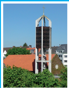
Vicelinkirche Harmsstraße 123