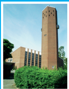
Heilandskirche Saarbrückenstr. 46