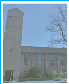
St. Jürgen-Kirche Königsweg 78 vermietet an die FeG Kiel